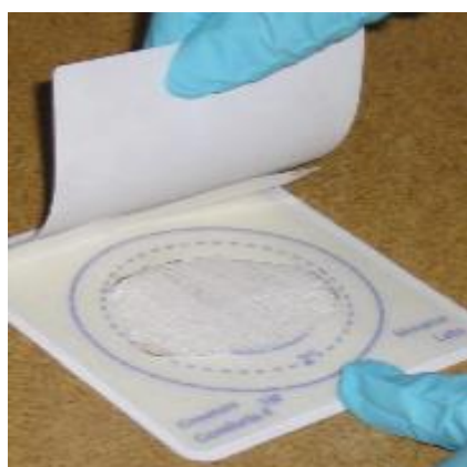
Figura 5: Apósito para larvas.

Mientras que dos artículos, Silva et al. (30) y Cazander et al. (15) coinciden con que los estudios existentes presentan restricciones, por ello es necesaria una mayor investigación sobre el tema, especialmente comparar con otras terapias, porque la disponibilidad de más resultados efectivos ayudará a mejorar la imagen que tienen los profesionales y los pacientes sobre la terapia larval.