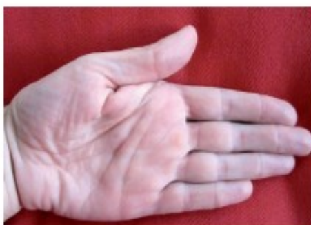
Fig2 Regra da palma da man