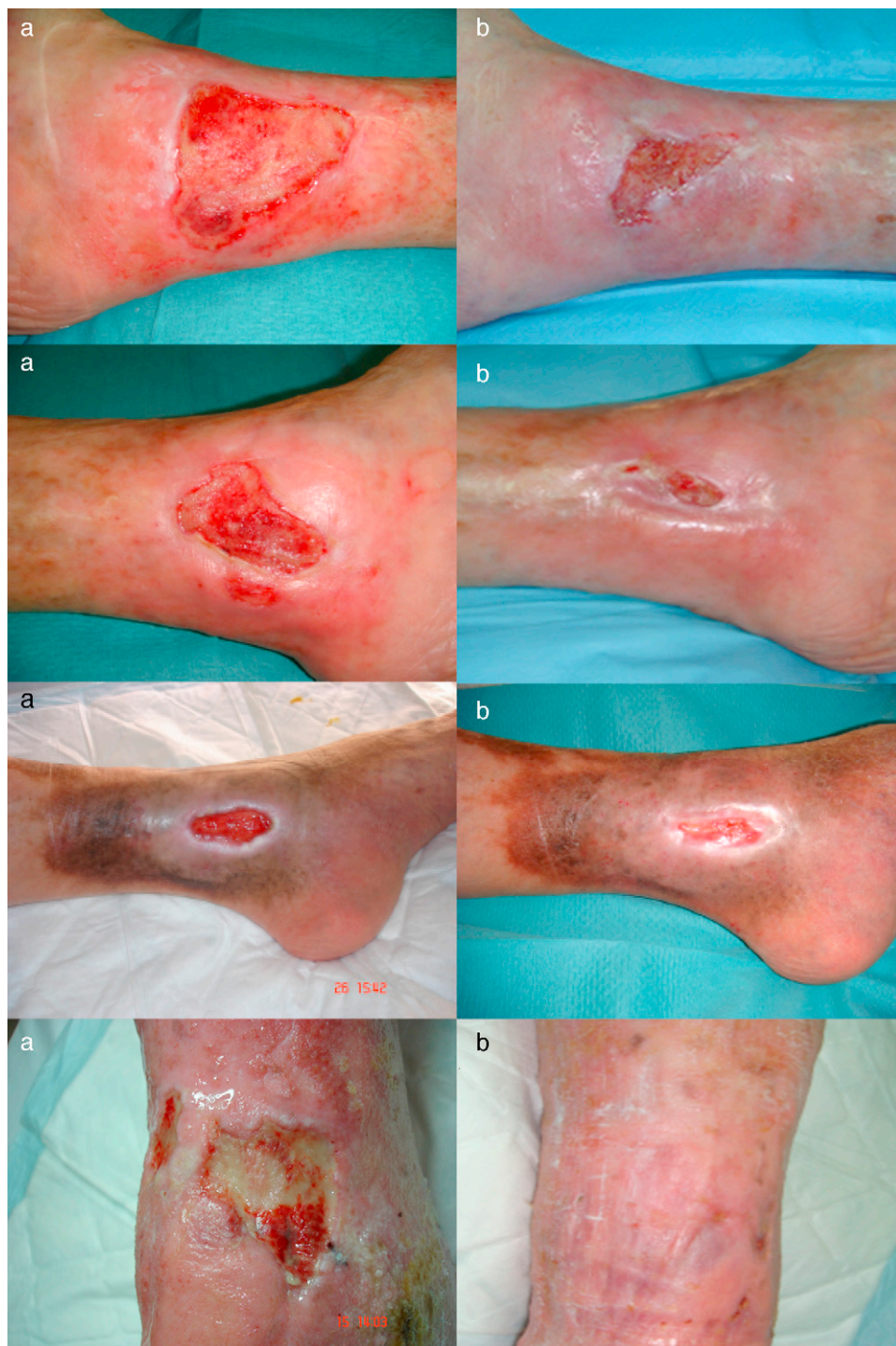
Figura 1 Área de las lesiones. A.Semana 0. B.Semana 16.