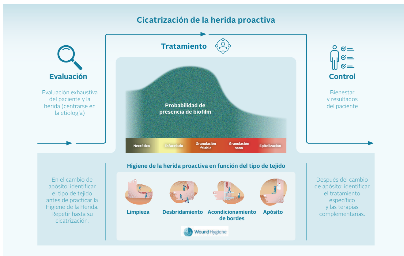
Figura 3. Marco de cicatrización de la herida proactiva

El marco de tres etapas (fig. 3) subraya la importancia de la evaluación, el tratamiento (mediante la Higiene de la Herida) y el control, con el fin de respaldar un enfoque más centralizado mediante el cual todos los profesionales de la salud que tratan heridas se sientan cómodos practicando la Higiene de la Herida.