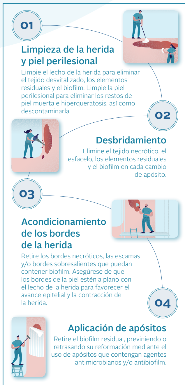
Figura 1. Los cuatro pasos de la Higiene de la Herida 1

de biofilm 26 . Además, el 70,1 % (n=897) de los participantes (N=1.280) afirmó que utiliza una estrategia antibiofilm para ocuparse del biofilm de las heridas 26 . En la última década, las técnicas de tratamiento del biofilm han consistido en el desbridamiento periódico, seguido de estrategias que evitan que el biofilm vuelva a formarse, como el uso de apósitos antimicrobianos tópicos 25 .