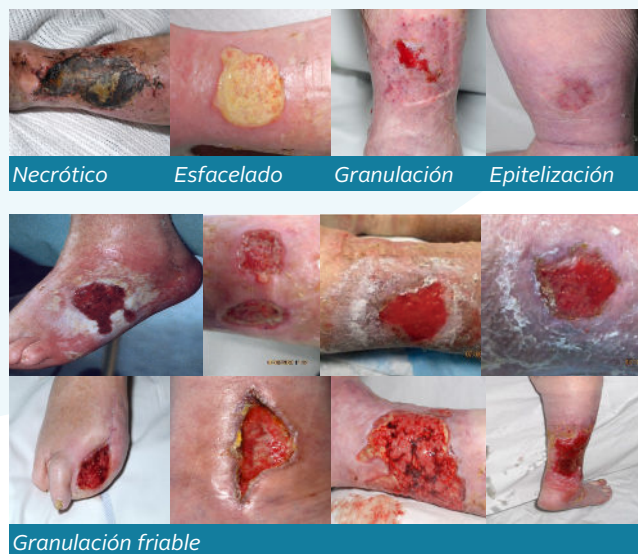
Figura 2. Tipos de tejido y el tejido de granulación friable

friable ayudará, en su lugar, a consolidar la idea de que este tipo de tejido es un obstáculo que se puede superar en las heridas de difícil cicatrización.